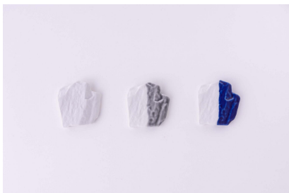
TOUSEKI A / 箸置