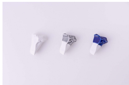
TOUSEKI C / 箸置