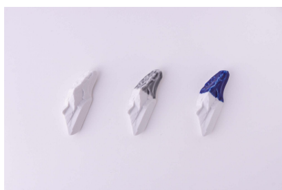
TOUSEKI D / 箸置