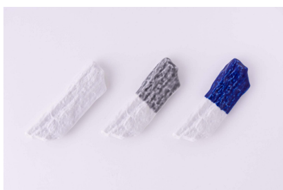
TOUSEKI E / カトラリーレスト